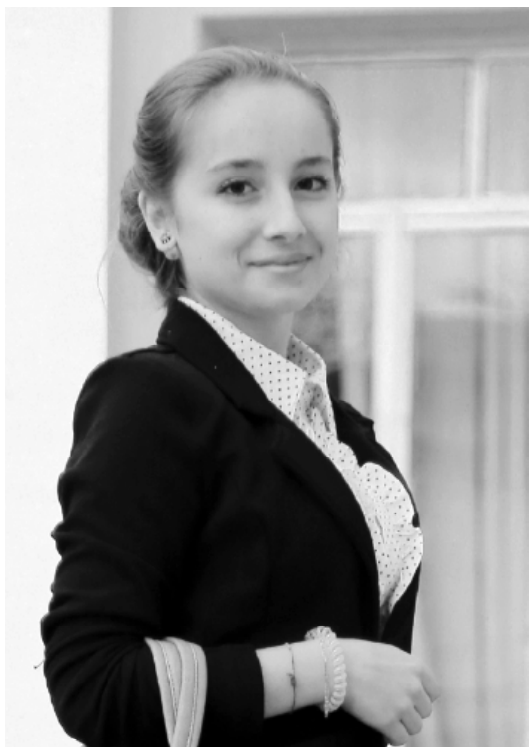
Новости от Мадины