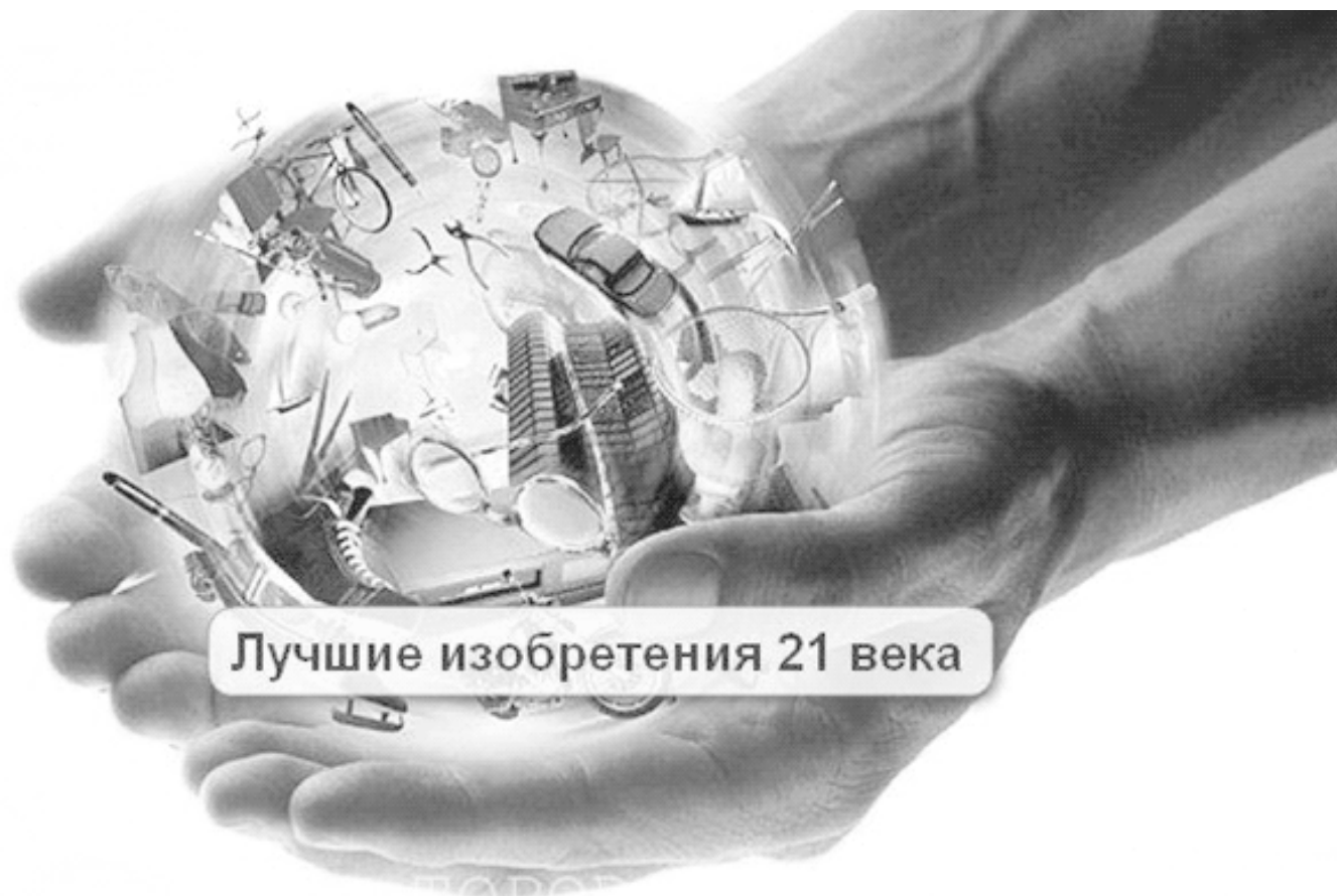
Лучшие изобретения 21 века

Это экстракорпоральное устройство подарит надежду всем тем, кто страдает от острой печеночной недостаточности. К сожалению, биоискусственная печень не может постоянно заменять настоящую, но она послужит отличным вспомогательным устройством и поможет улучшить качество жизни пациентов, ожидающих своей очереди на трансплантацию.