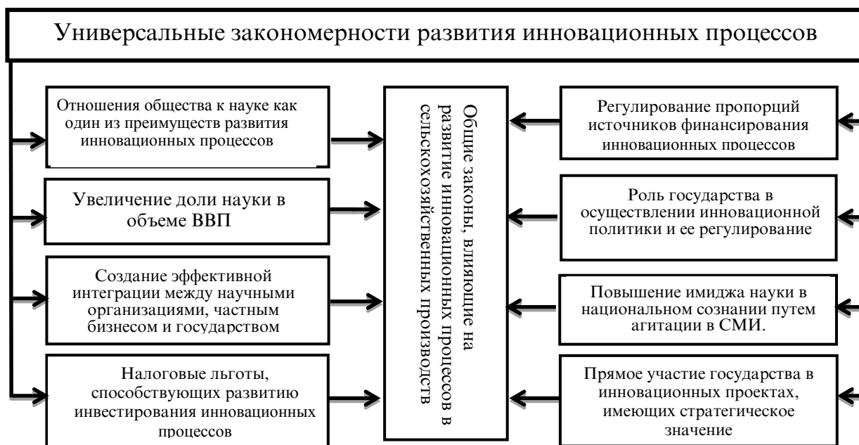
Рис. 2. Универсальные закономерности влияющие на инновационные процессы.

В этой связи, при планировании инноваций и управления инновационной деятельностью предприятий и хозяйств, следует учитывать факторы и особенности сельскохозяйственного производства республики, а также вышеперечисленные закономерности.