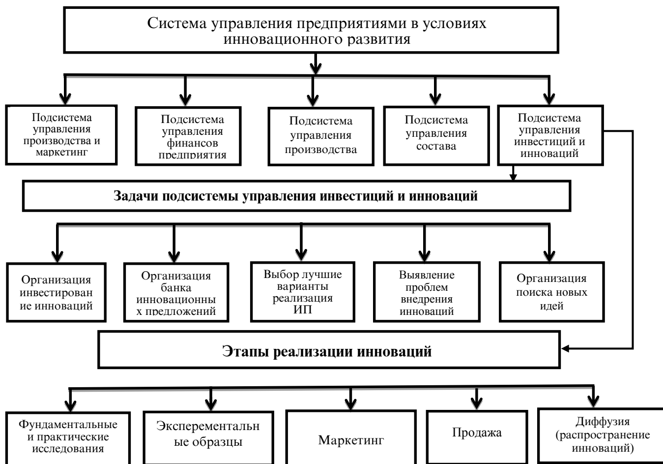
Рис. 1 Подсистема управления инновационной деятельностью предприятий и ее состав.

управления деятельностью предприятия, направленную на эффективную реализацию инноваций на предприятии, а её конечным результатом для предприятия может быть прибыль, а также какие-либо социальные или экологические результаты (Рис 1).