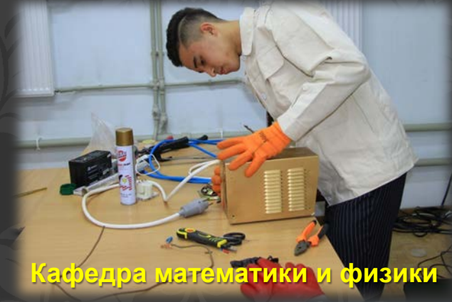
Кафедра математики и физики