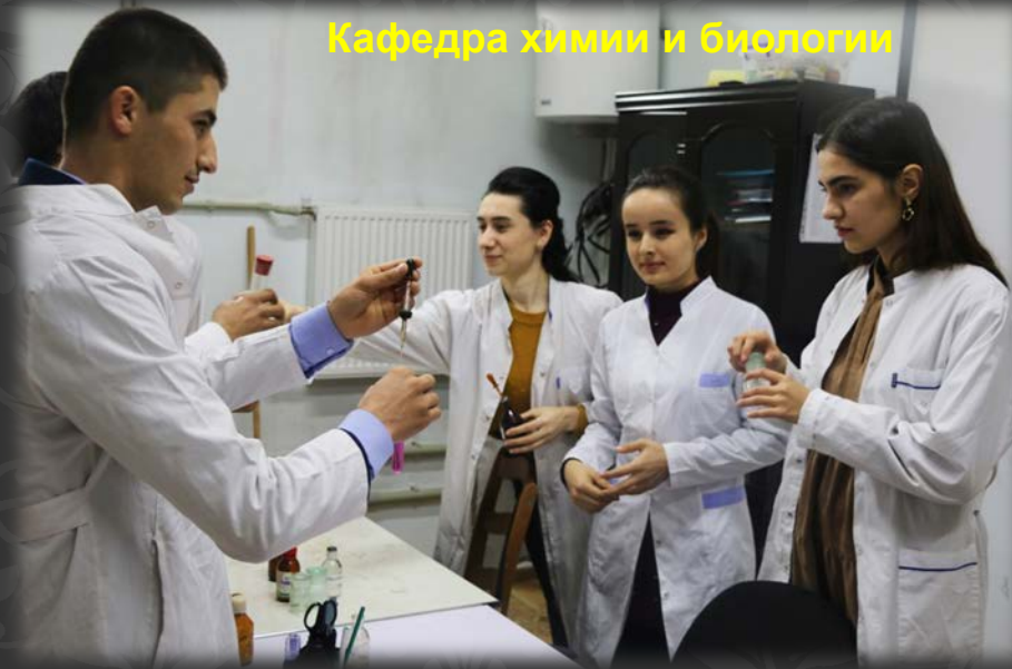
Кафедра химии и биологии

1 августа 2020 года в Российско-Таджикском (Славянском) университете образовался естественно-научный факультет. На факультете функционируют следующие кафедры: