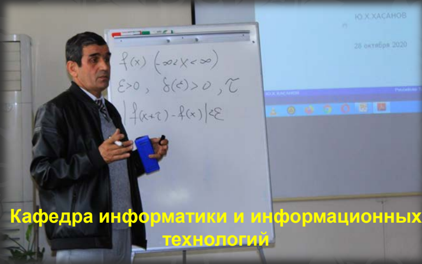
Кафедра информатики и информационных технологий