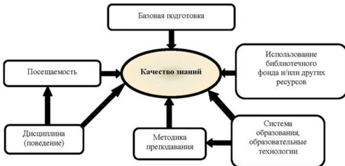
Рис.1. Факторы, влияющие на качество знаний студентов

Известно, что качество знаний студентов зависит от ряда факторов. На рис. 1 показаны основные факторы, влияющие на качество знаний студентов